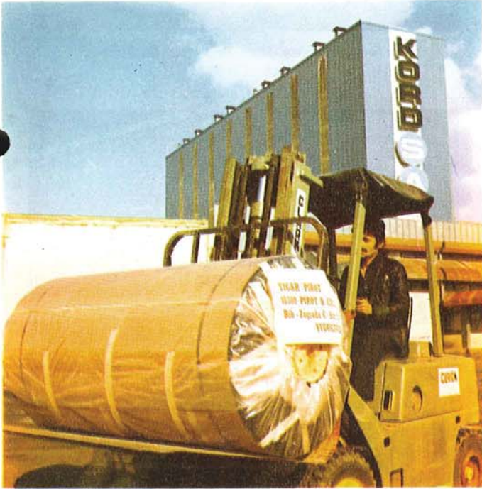
Yugoslavya'ya sevk edilmek üzere yüklenen Kord Bezi Rulosu

Bu senede, şirketimiz ihracatçı Birlikleriyle, Sanayi Odalarından «Başarılı İhracatçı» beratını almış ve altın madalya ile ödüllendirilmiştir.