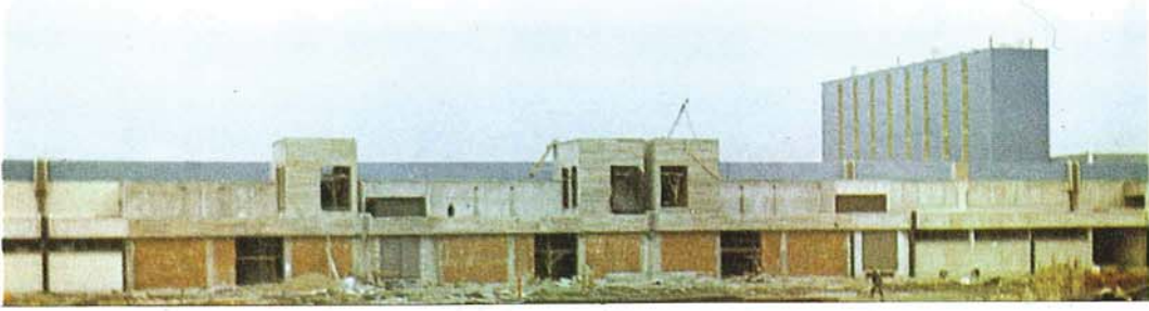
Tevsi Projemiz ile ilgili inşaatımızdan bir görünüş (EYLÜL 1979)