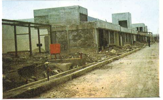
Tevzi inşaatımızdan diğer bir görünüş (KASIM 1979)

Sürekli artan iç ve dış pazar taleplerini karşılayabilmek için büküm ve dokuma kapasitemizi 14.800 Ton/yıla çıkarmak ve bazı yan mamul üretimini gerçekleştirebilmek üzere başlattığımız tevsi projemizin inşaat bölümü tamamlanmış bulunmaktadır.