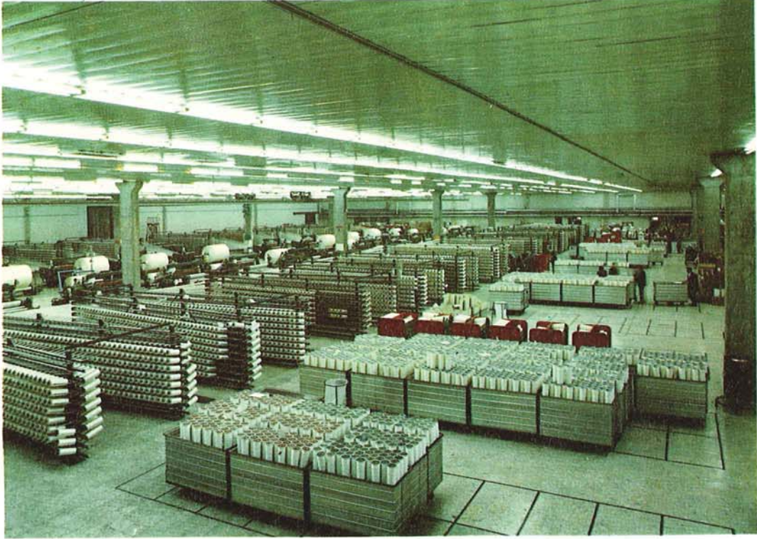
Dokuma ve katlı büküm kısmından bir görünüş

1979 yılının ağır ekonomik şartlarına rağmen, şirketimiz üretim üniteleri, tesbit edilen kalite, miktar ve verimlilik hedeflerine ulaşmış, dünya standart ve normlarına uygun kord bezi imaline devam etmiştir.