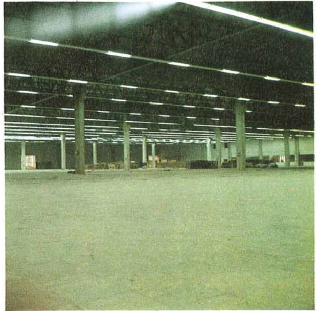
Makine montajına hazır kapalı saha'dan bir görünüş (ŞUBAT 1980)

Dış paraya ihtiyacımızı azaltan ve hammaddeye doğru entegrasyonu sağlamak üzere kurulması düşünülen «endüstriyel iplik üretim» projemiz ile ilgili temaslarımız ve teknik çalışmalarımız son aşamasına gelmiştir. Ancak, projemizin gerçekleştirilmesi, bu yeni teknoloji için gereksinimini duyduğumuz ve büyük rakamlara ulaşan dış krediye bağlı olduğundan, gerekli kredinin temin edilebilmesi halinde projeye başlanması mümkün olabilecektir.